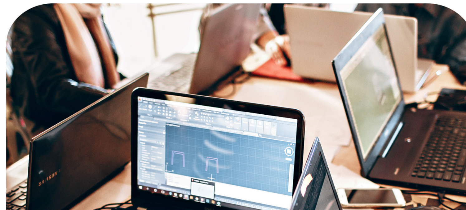
Necesidades de los usuarios “Empleados”